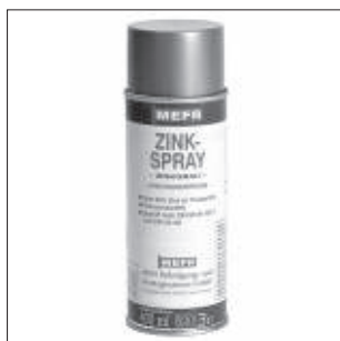
Zinkspray (Zink primer)