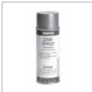
Zinkspray Side 10/3