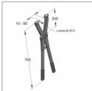
Hultang 700 mm