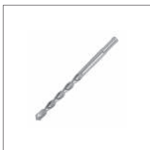
Bor Side 10/5