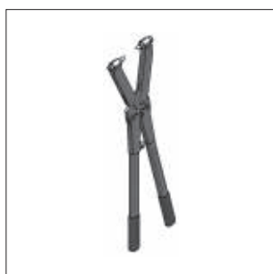
Hultang Side 10/6