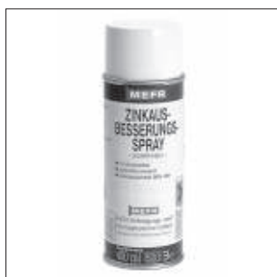
Zink Coating spray