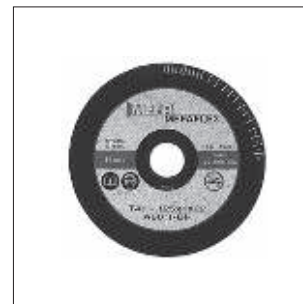
Skæreskive MEFAFLEX Side 10/4