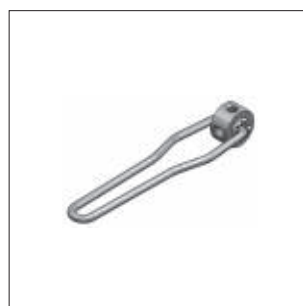
Multinøgle Side 10/6