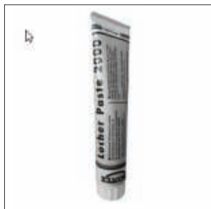
Tætningspasta 2000 Side 10/2