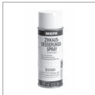
Zink Coating Spray Side 10/3